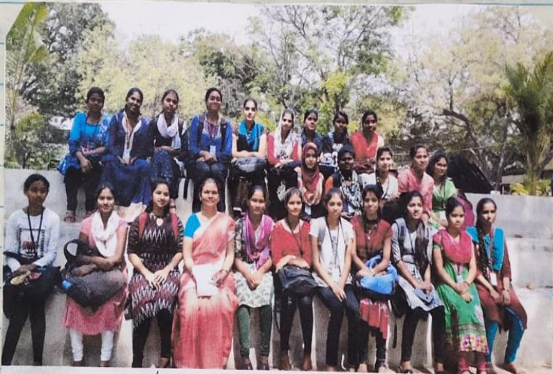
శ్రీత్రపత్నీలునూ భాగంగా విద్యార్థులూ అభ్యాసకులూ

ఉస్మానియా విశ్వవిద్యాలయ ము నుండి శ్రీత్రపత్నీలు కార్యం వెళ్ళి సందర్శించిన విద్యార్థులకు దినోత్సవం.