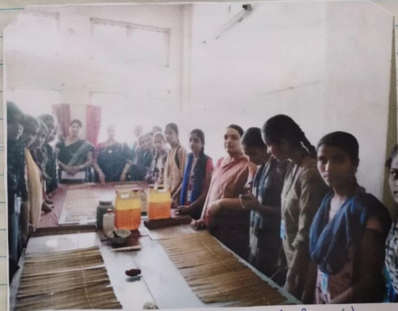
అంబేద్కర్ గ్రంథాలయ విద్యార్థుల పరిశీలనలు.