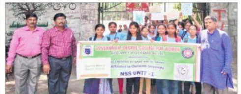
ర్యాలీ నిర్వహిస్తున్న బేగంపేట ప్రభుత్వ మహిళా డిగ్రీ కళాశాల విద్యార్థినులు