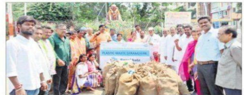
ప్లాస్టిక్ వేస్ట్ క్రమధాన్ కార్యక్రమంలో పాల్గొన్న కార్పొరేటర్, డీఎంసీ