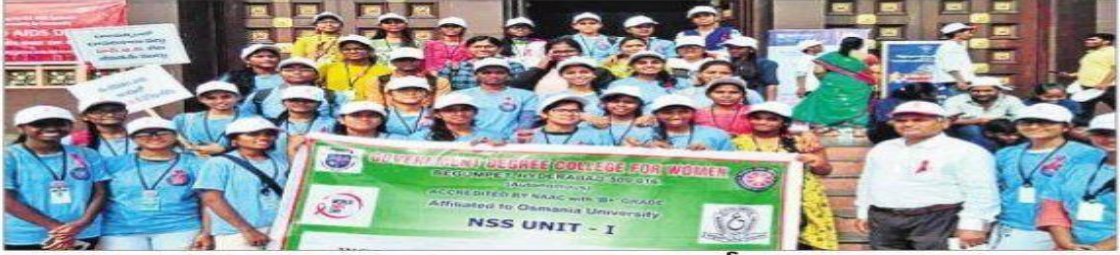
అవగాహన ర్యాలీలో పాల్గొన్న బేగంపేట ప్రభుత్వ మహిళా డిగ్రీ కళాశాల విద్యార్థినులు