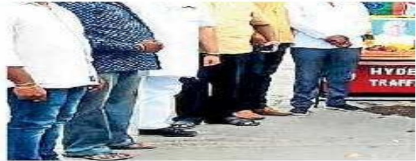
సంజీవరెడ్డినగర్ : పటేల్ చిత్రవ