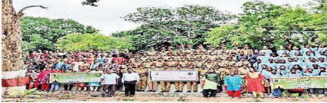
పేగంపేట మహిళా కళాశాలలో ఎన్ఎస్ఎస్ కెడెట్ల ప్రదర్శన

Date : 01/11/2019 EditionName : TELANGANA ( HYDERABAD, SANATH NAGAR ) PageNo : 01