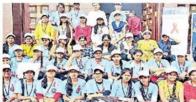
అవగాహన ర్యాలీలో పాల్గొన్న బేగంపేట ప్రభుత్వ మహిళా డిగ్రీ కళాశాల విద్యార్థులు, అధ్యాపకులు