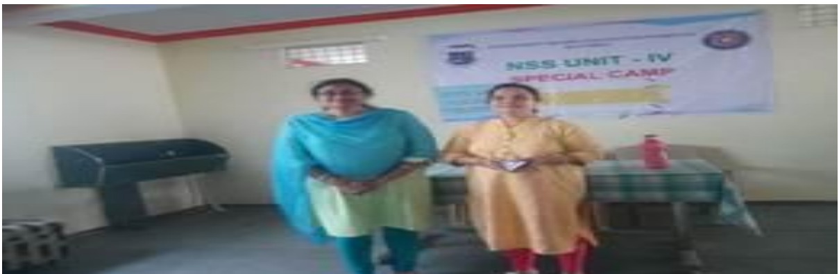
Free Medical Camp organized in collaboration with Lions club, Hyderabad