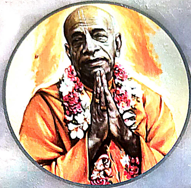
His Divine Grace A.C. Bhaktivedanta Swami Prabhupada

Founder-Acharya of the International Society for Krishna Consciousness