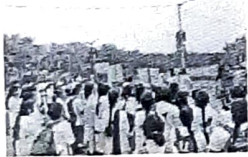
Rally at Government College Hyderabad, N.T.P.C.

We for Women creating awareness on breast cancer RISE- Rally in supporting, serving and screening Everyone- by We for Women