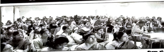
సదస్సుకు హాజరైన విద్యార్థులు