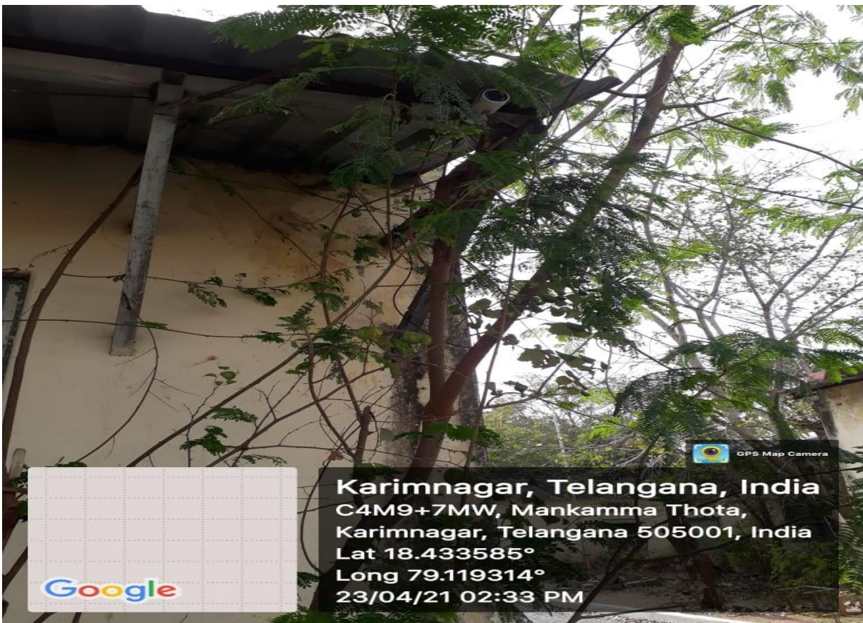
Safety and Security (C.C.Cameras)