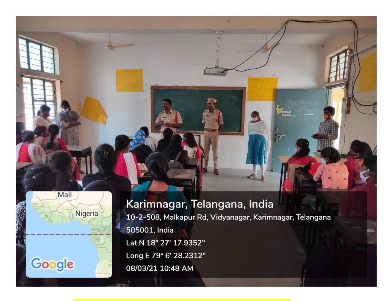
Awareness session on Anti Ragging by Police Dept.