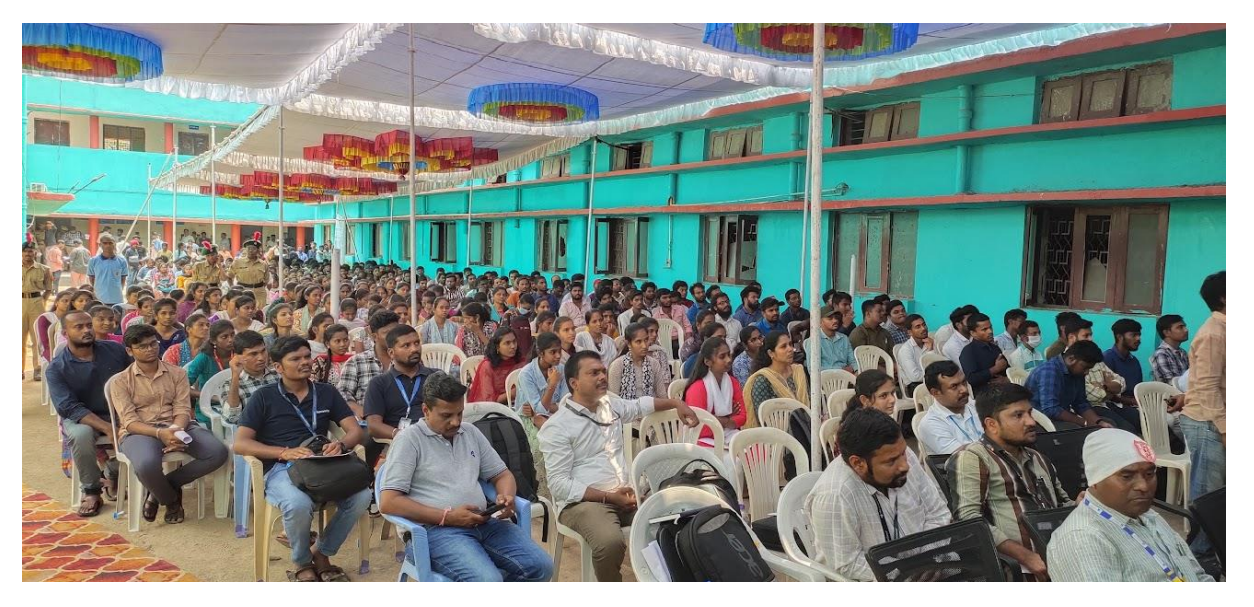
Job Drive gathering