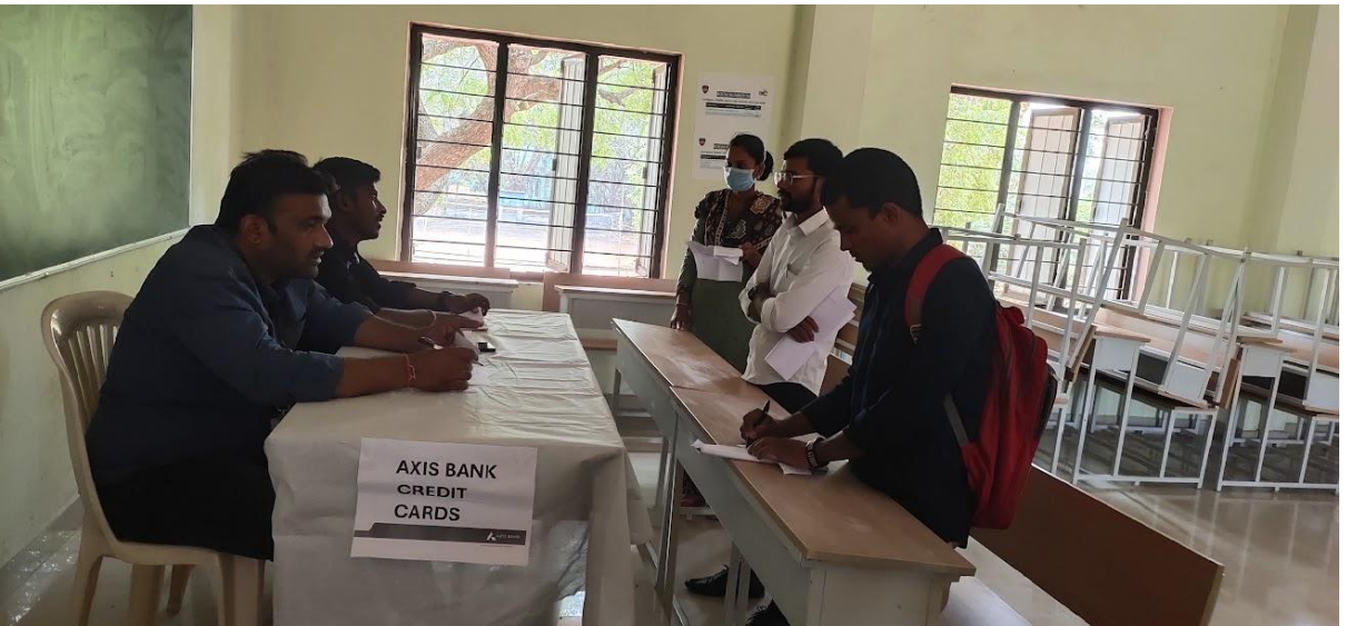
Interviews and assessing sessions