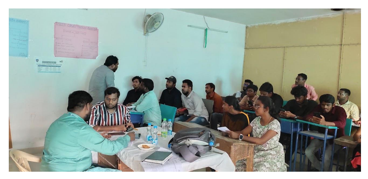
Interviews and assessing sessions