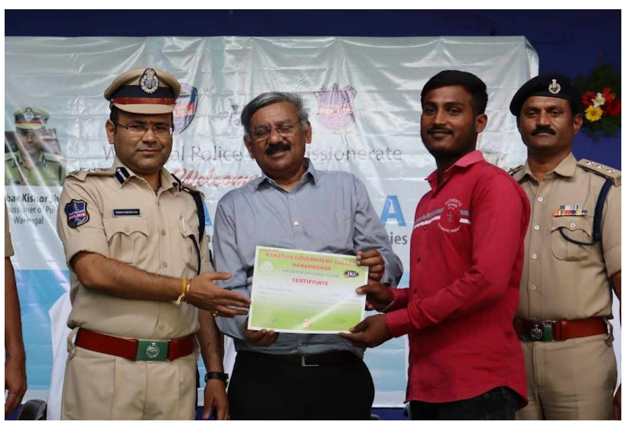
Job Offer letter distribution by honorable \operatorname{CP} and \operatorname{TMI} group chairman