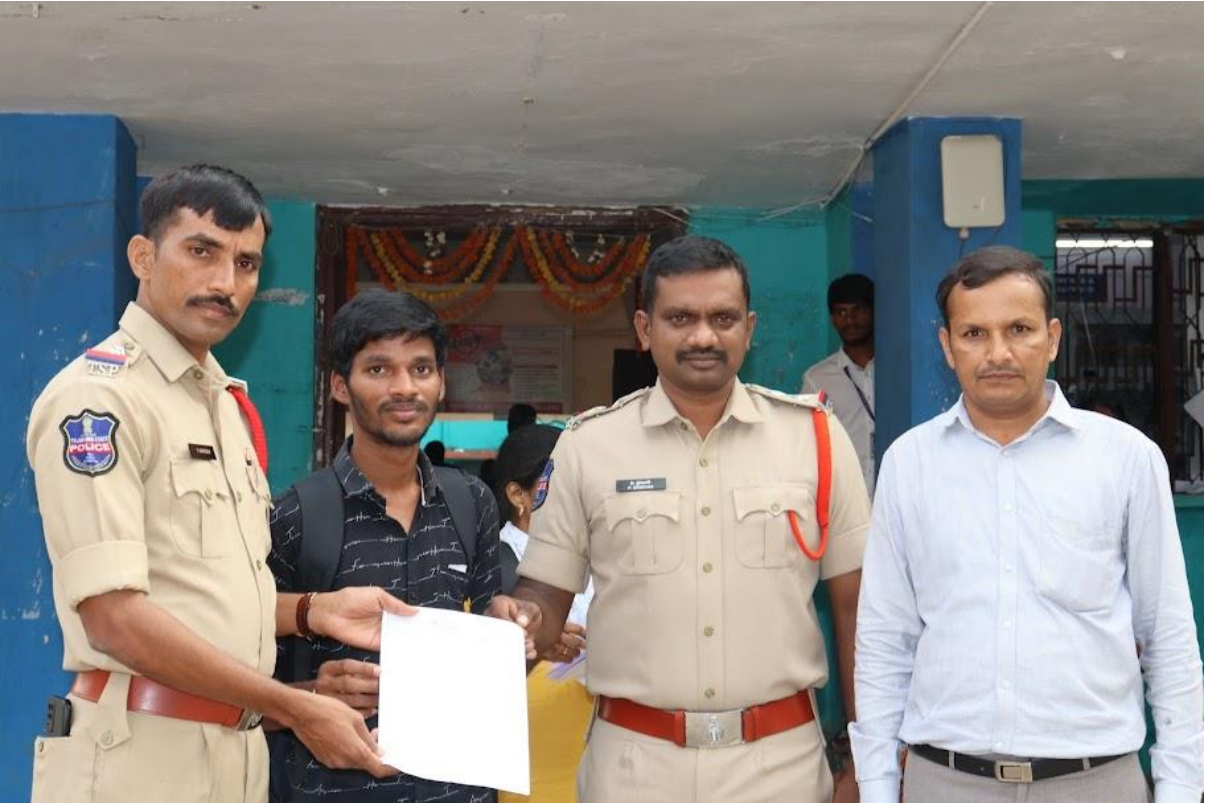
Job Offer letter distribution by police officials and placement officer