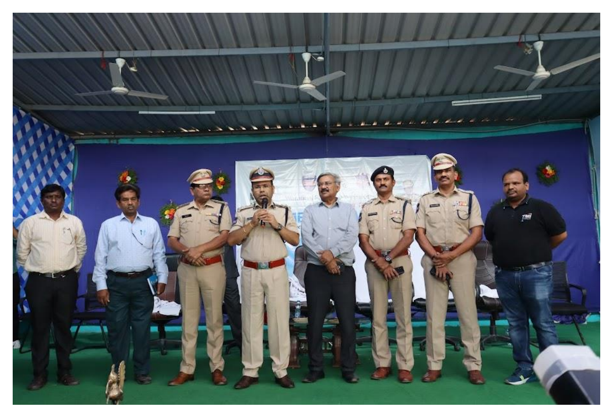
Job Drive inaugural addressing by Sri Ambar Kishore Jha, IPS ,Commissioner of Police, Warangal police Commissionerate