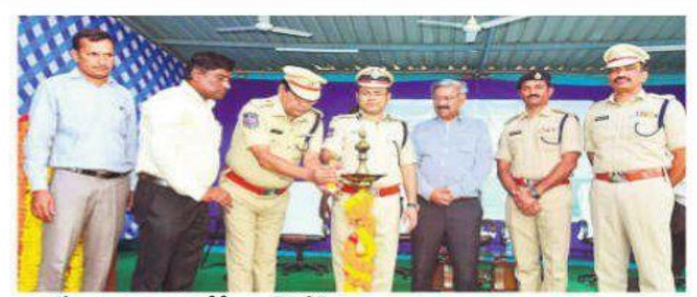
జాబ్ మే కాను ప్రారంభిస్తున్న సీపీ అంబర్ కిశోర్ ఝా