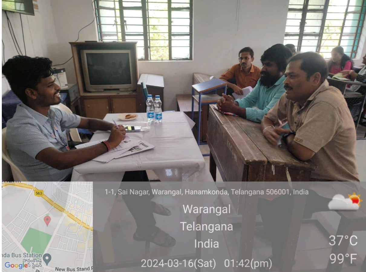
Job Drive: aspirants registration and parents counselling