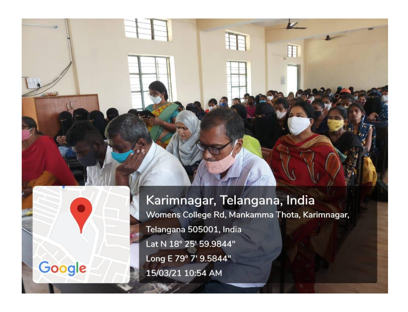
World Consumer Rights Day 15<sup>th</sup> March 2021