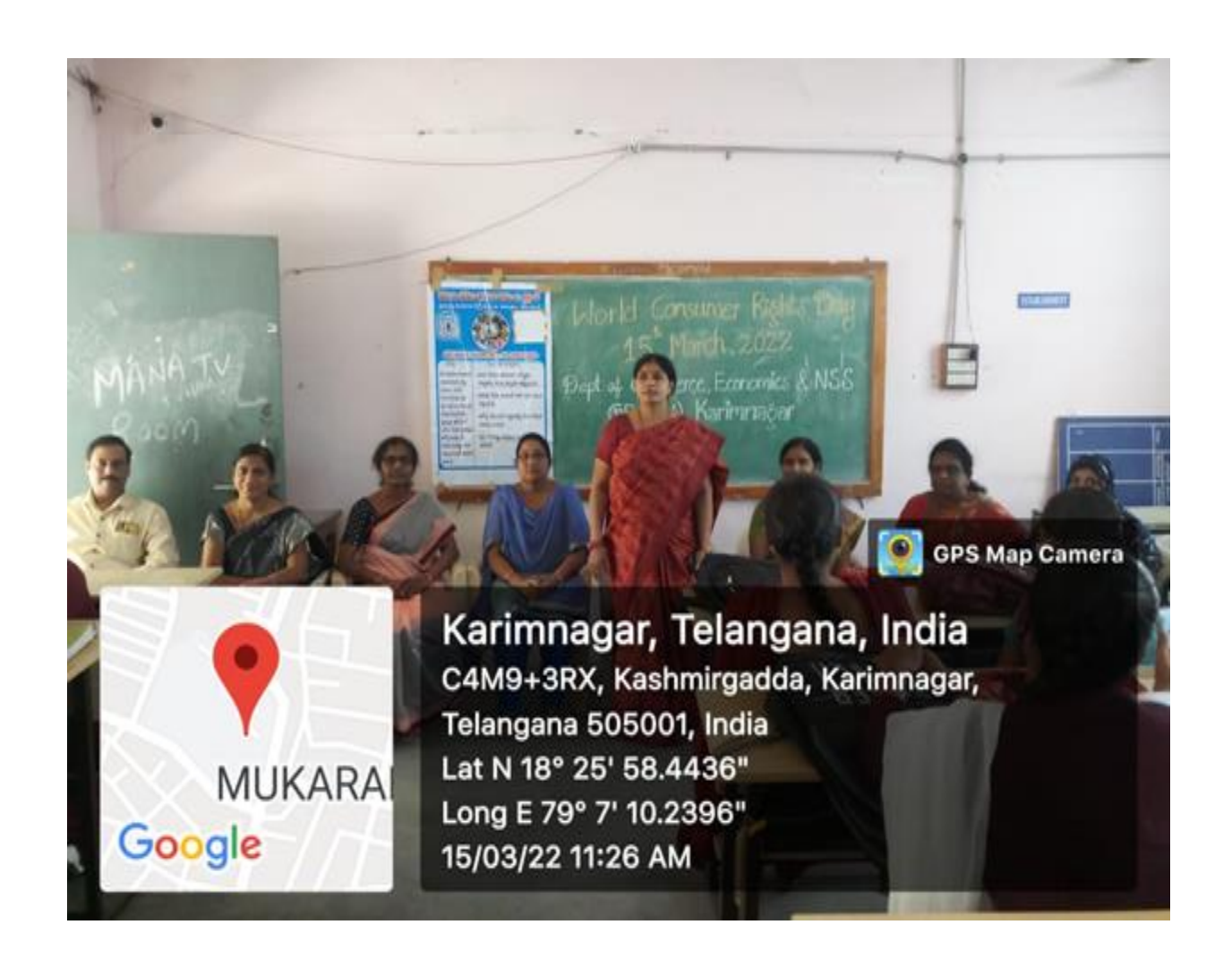
World Consumer Rights Day 15<sup>th</sup> March 2022