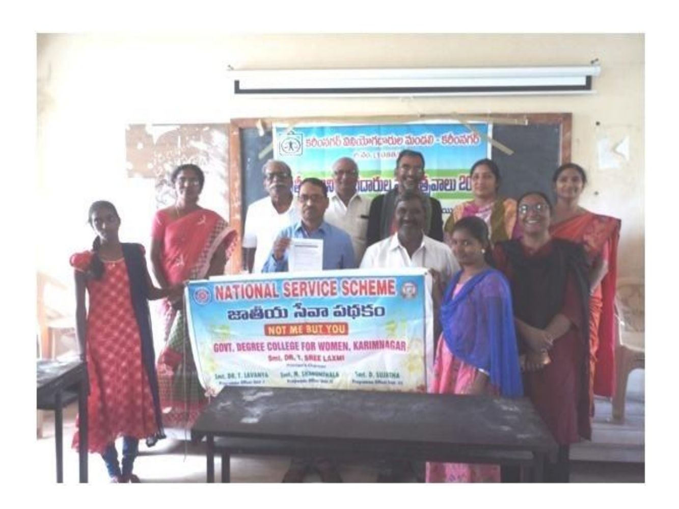
National Consumer Awareness Week 2019