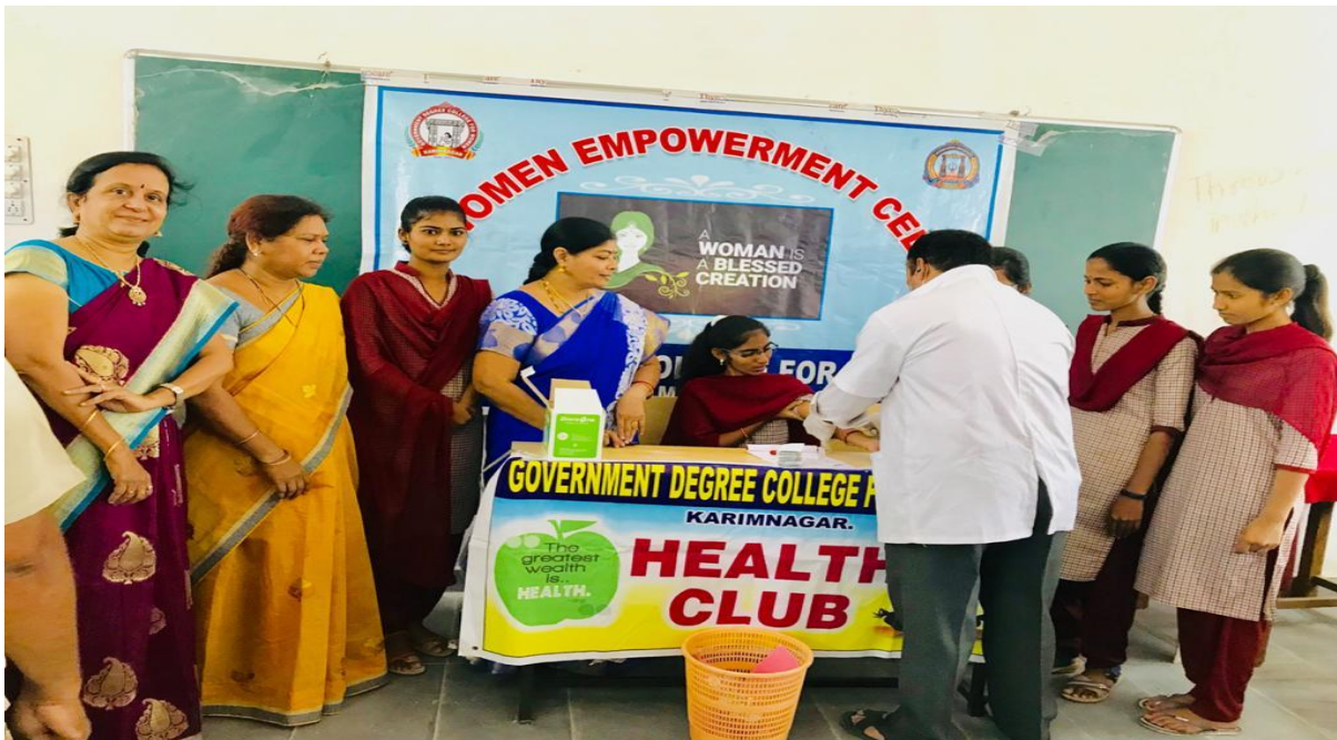
Collection of Blood sample of Students on 02-03-2020