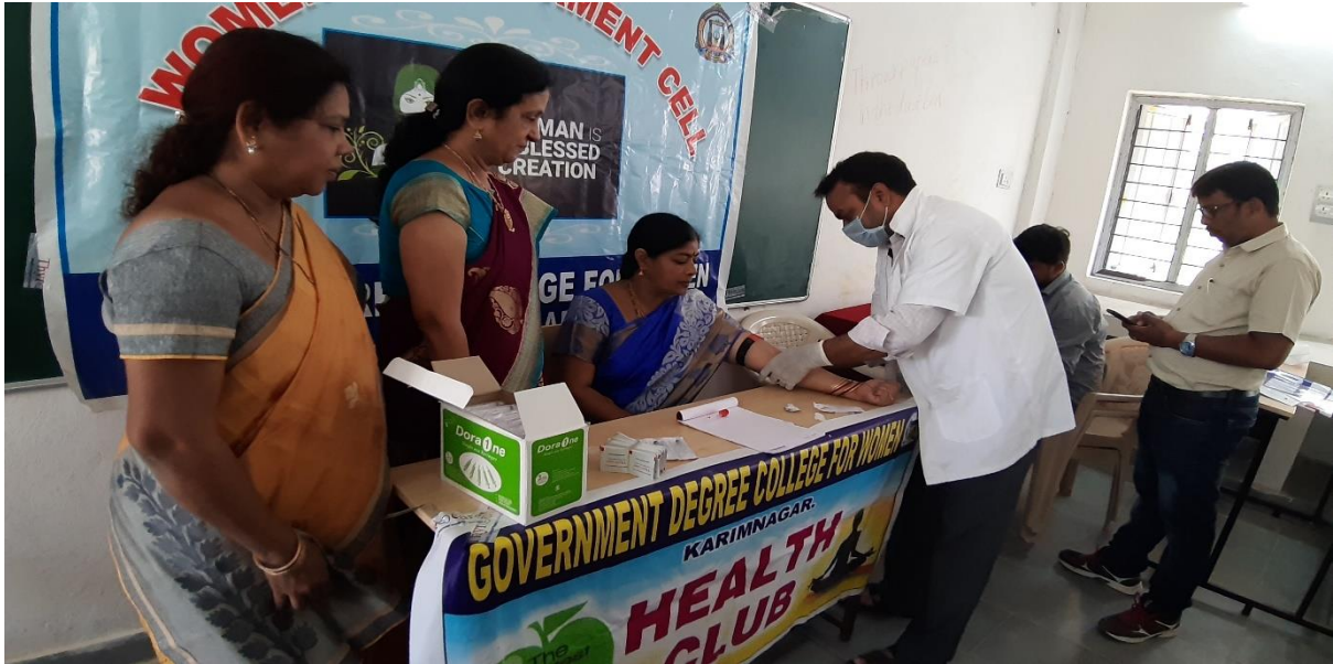
Collection of Blood sample of Principal on 02-03-2020