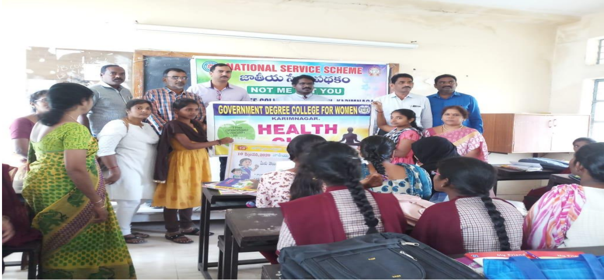
Distribution of Albendazole Tablets by Health Department at GDC (W) KARIMNAGAR.