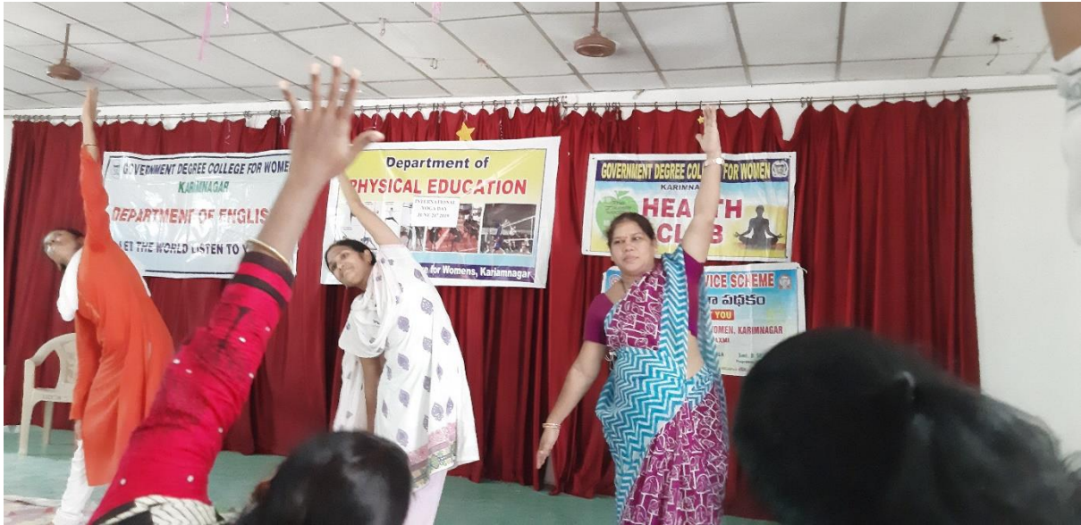
Lecturers performing Yoga asanas.