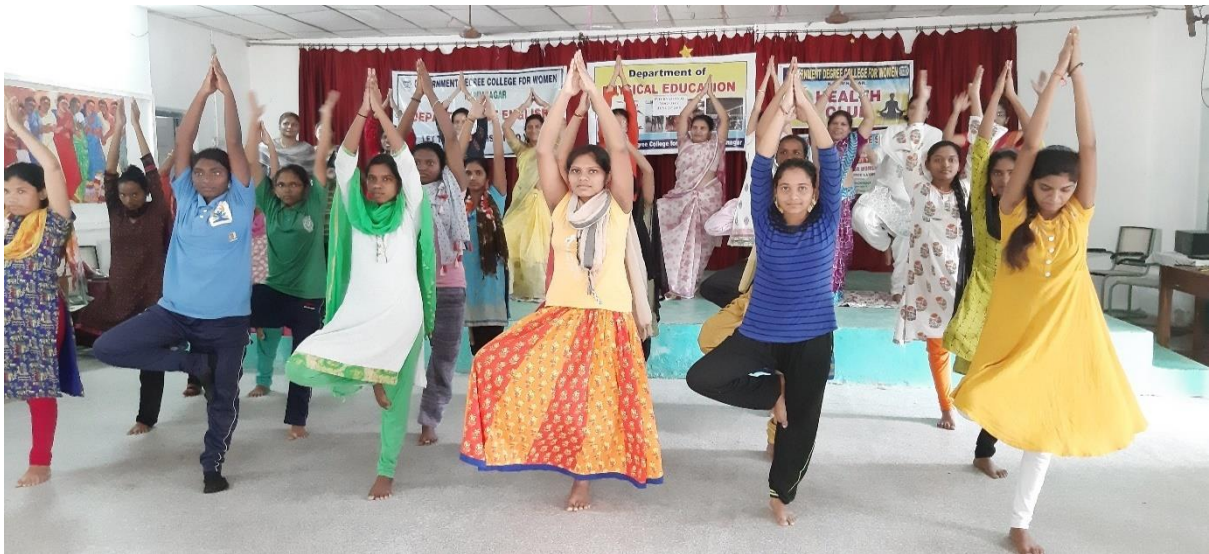
GDC (W) Karimnagar Students performing Yoga Asanas on Yoga day