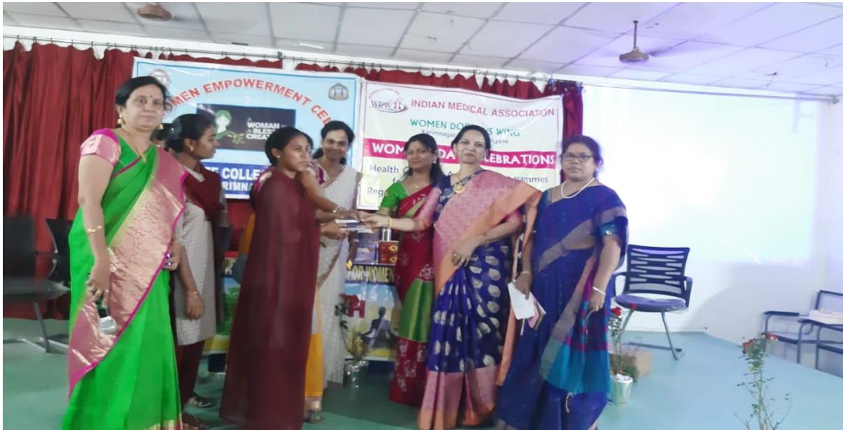
Distribution of Multi vitamin tablets to the students