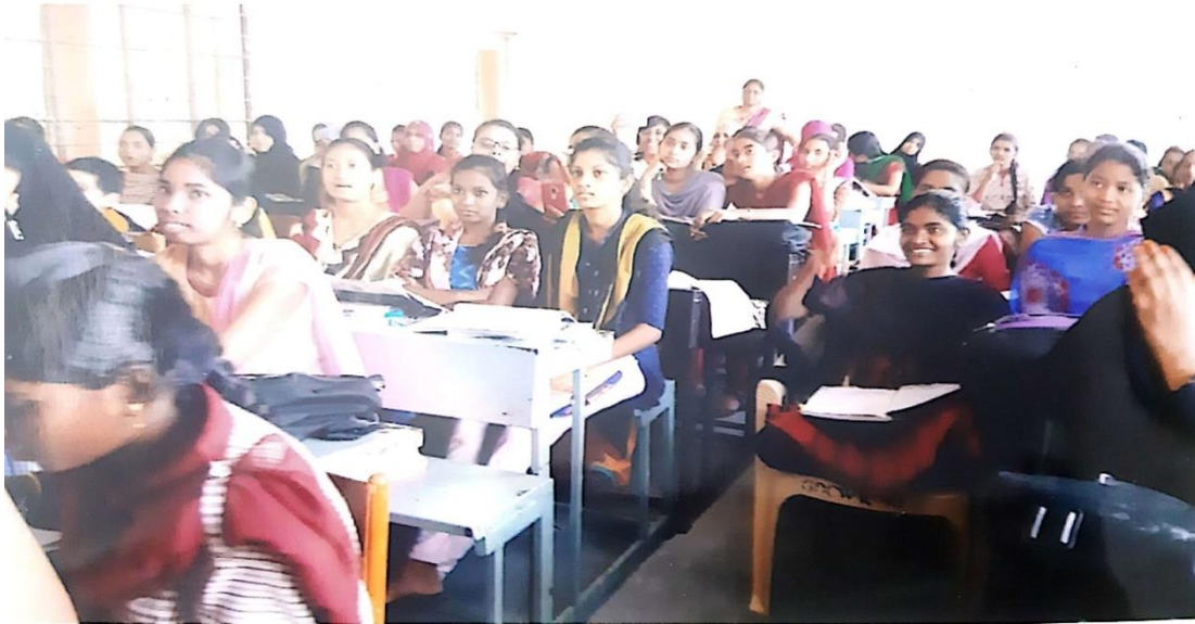
GDC (W),Karimnagar Students participating in Tallipala varosthavalu Programme on 06-08-2020