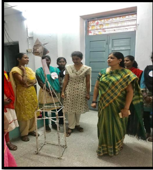
Principal acted as Judge in Paper tower exhibition.