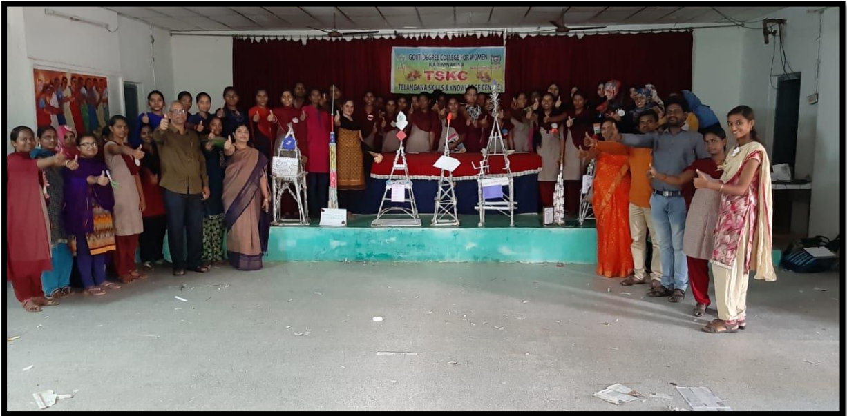
Students Exhibited Paper towers.