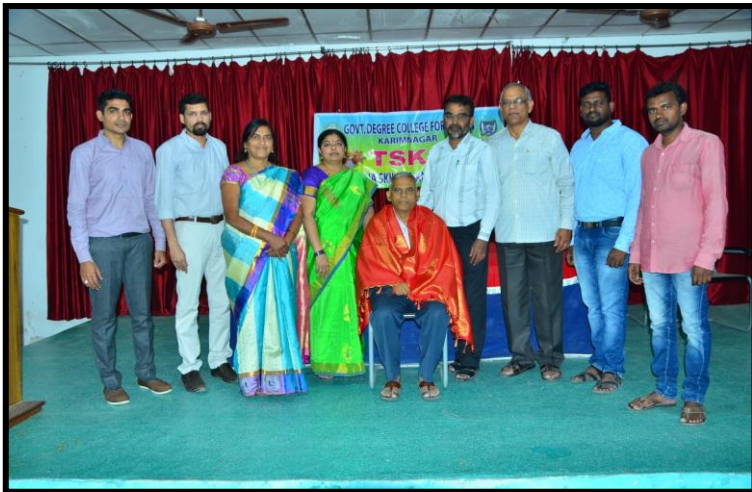
Felicitaton to Chief guest by TSKC.