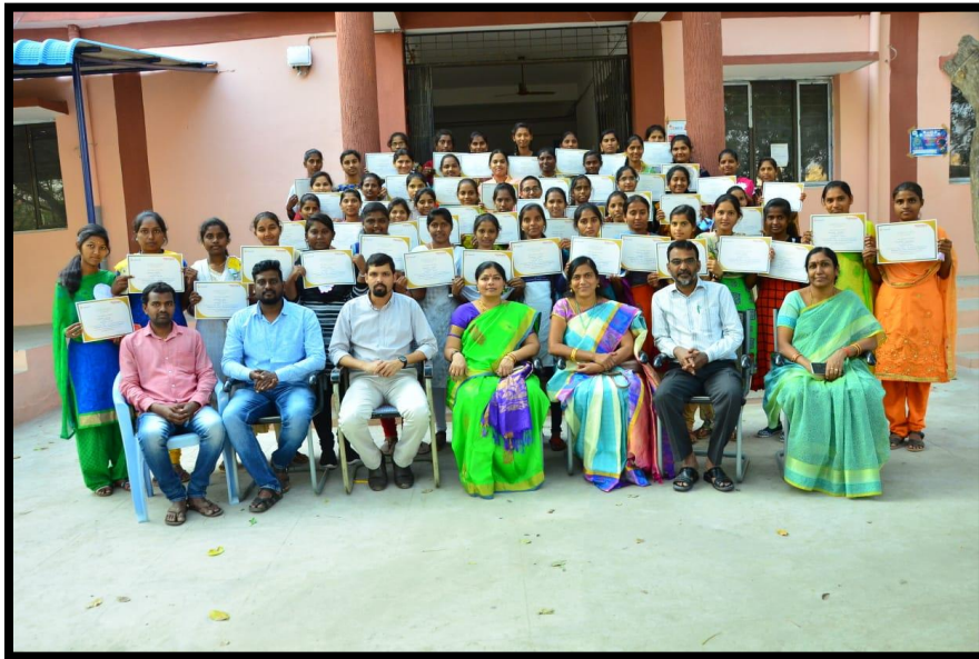
Trainer Kiran with Principal, Coordinator, Faculty and Students.