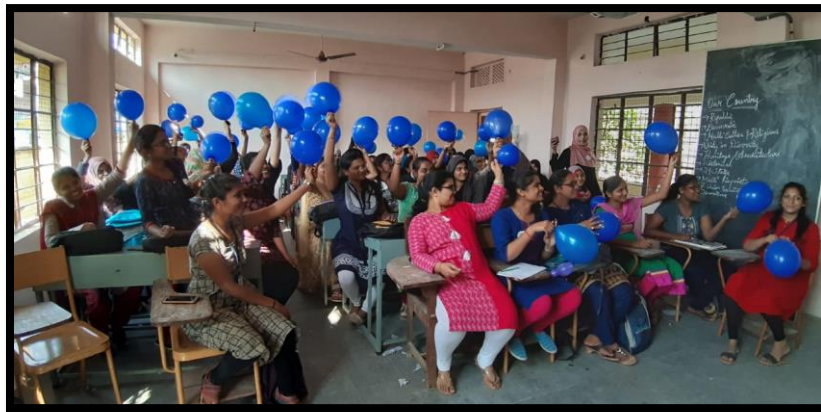
Balloon show activity to inculcate value of Integrity.