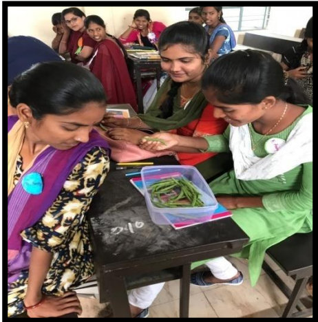
Students involving in Team work.