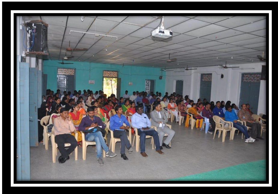
Candidates present on JOBMELA