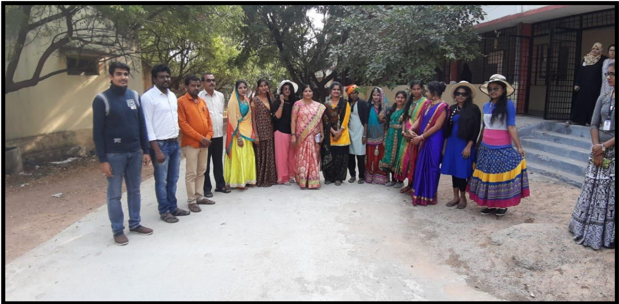
Principal and TSKC Mentors with students in different cultures of States.