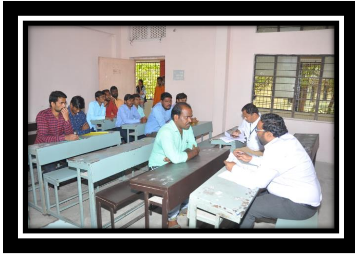
HDBF Conducting interview