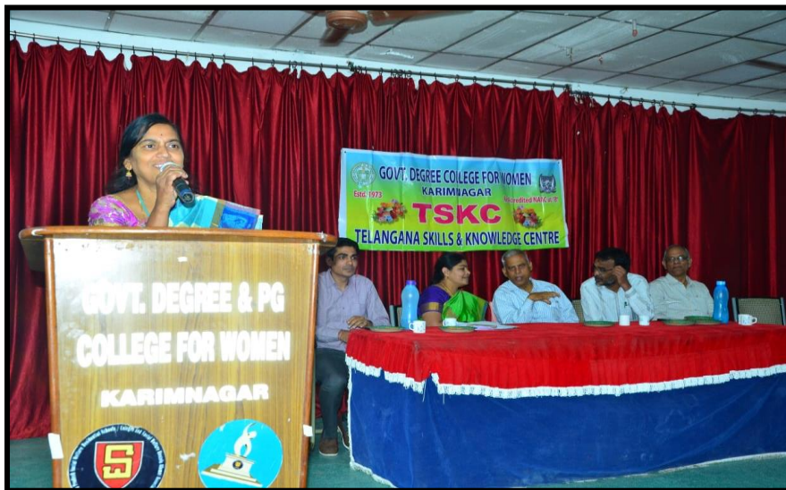
Welcome address of TSKC Coordinator on Valedictory function.