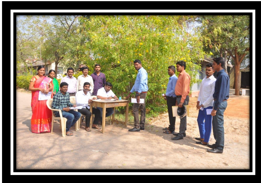
Registration of Candidate on JOB MELA