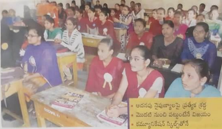
శిక్షణలో పాల్గొన్న విద్యార్థినులు