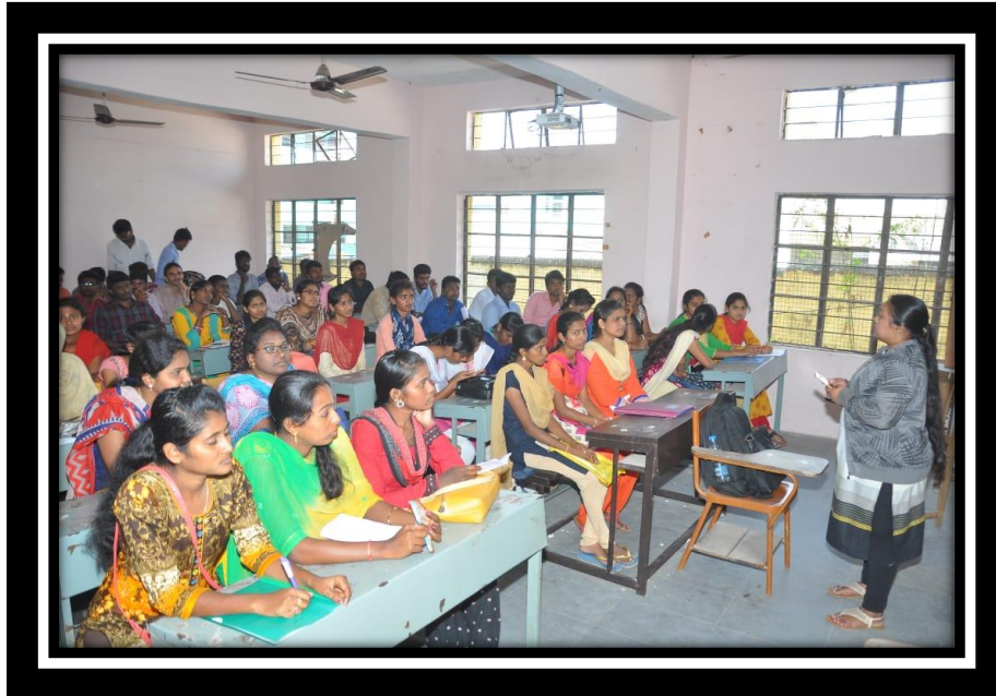
HR from ICICI explaining JOB Profile