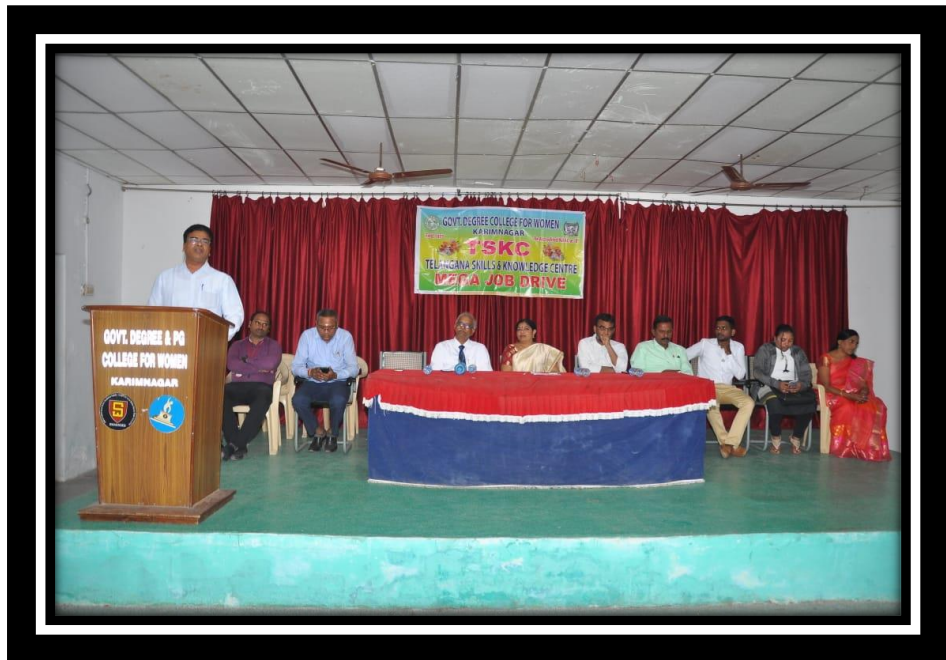
HR from Adarsh Motors Ltd Addressing