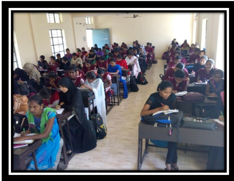
Students writing exam on GK and Current affairs.

TSKC is ahead in promoting awareness and updating of General knowledge and current affairs basing on competitive exams to the students. As a best practice TSKC is procuring material on G.K. and current affairs and compiling wall magazine called “Diksuchi”. It is pasted on walls at prominent places in the college. Xerox copies of same will be given to the students. Students were be given sufficient time for preparation and examination will be conducted basing on material support.