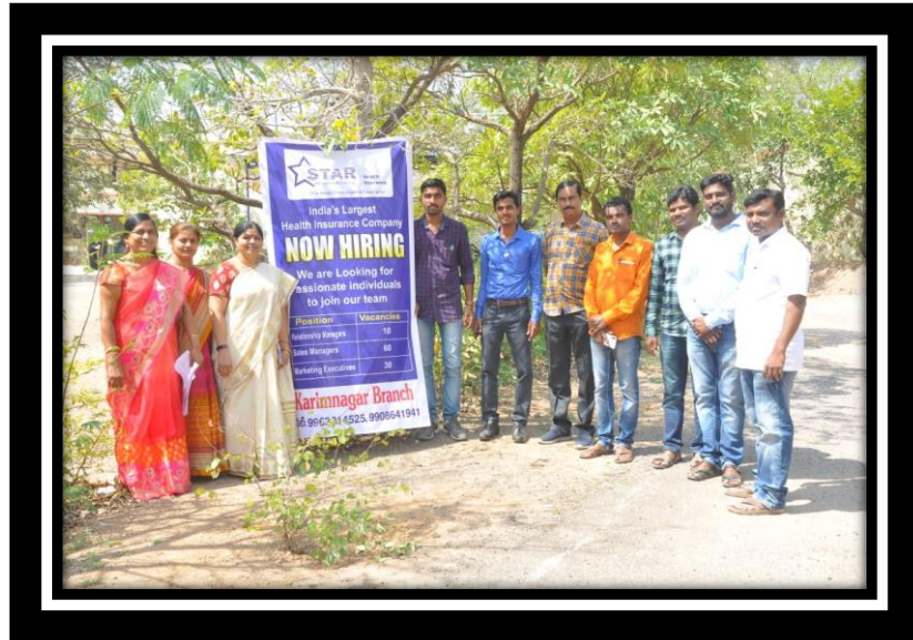
Principal and faculty