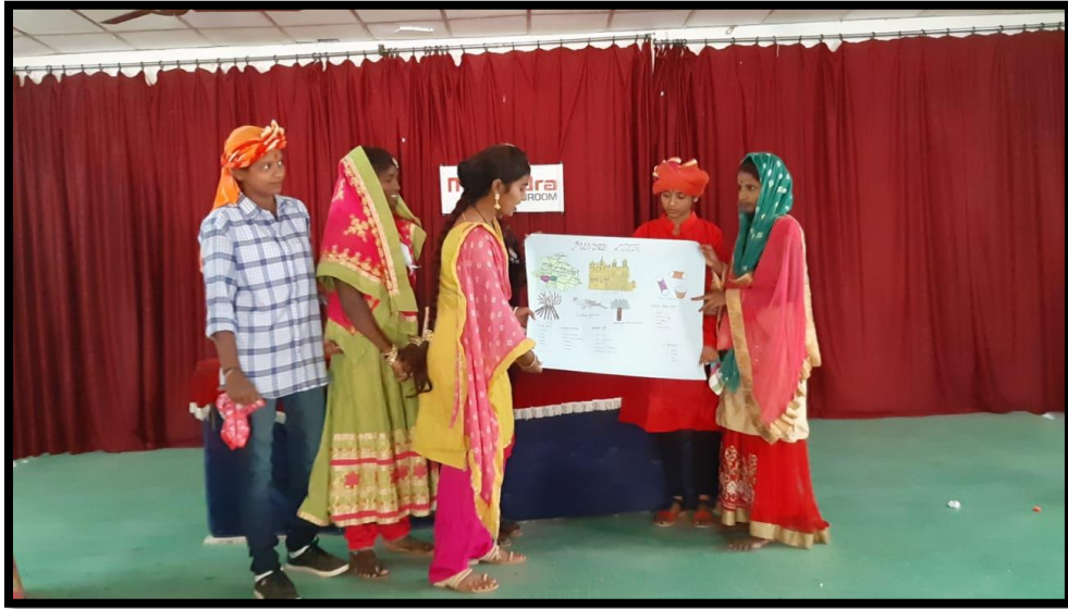
Fancy dress show to multi culture of India.