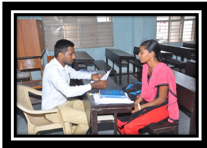
HR from star health insurance Conducting interview