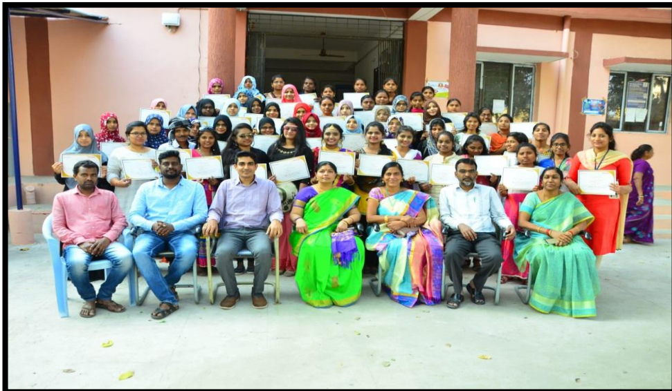
Trainer Shrenik with Principal, Students and faculty