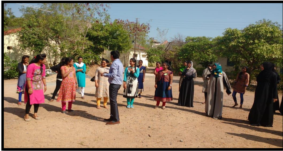
Warm up Exercises