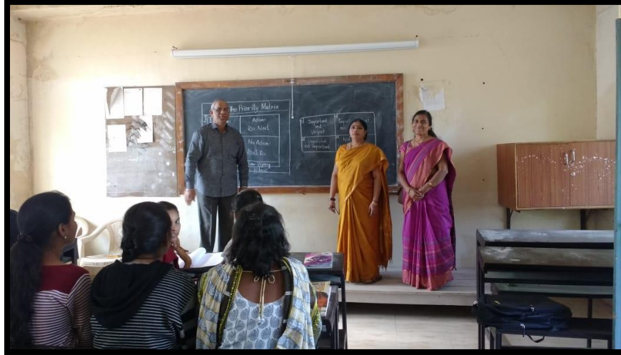
Principal and TSKC Coordinator in Mahindra Pride class room