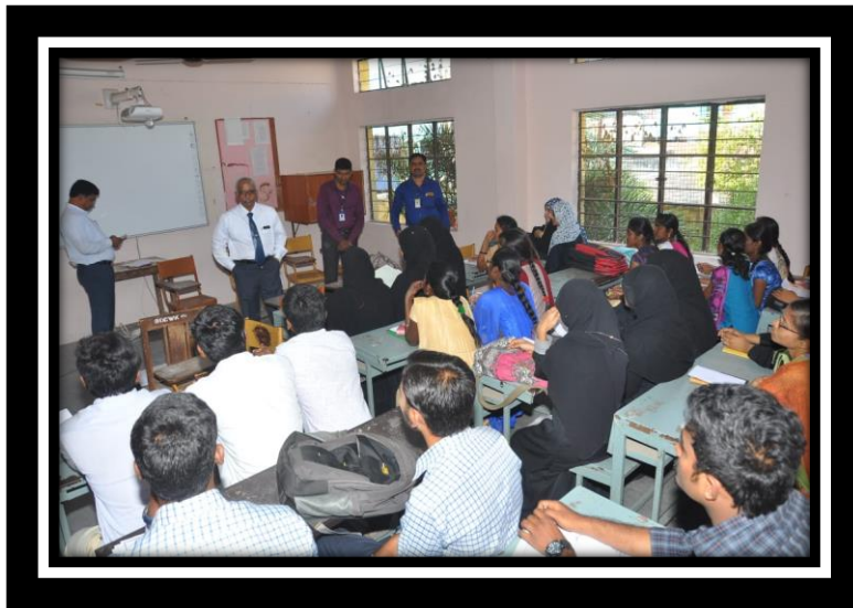
Managers from LIC Creating awareness on various jobs of LIC