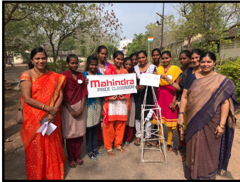
Students built Paper tower.