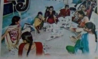
టీం వర్క్పై విద్యార్థినుల కృత్యాలు