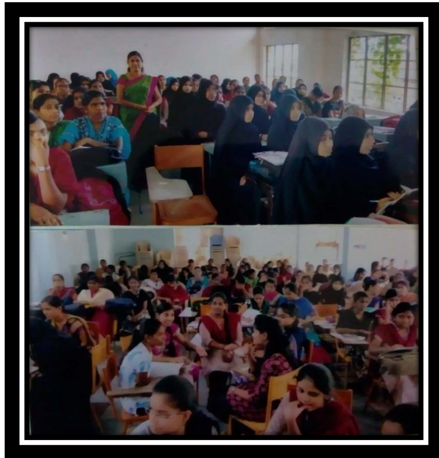
Students participate in workshop and GD

TSKC has conducted workshop on Interview skills on 22/10/2018 and given handouts to students on interview skills. In the work shop TSKC coordinator gave lecture on interview skills. At the end of the coordinator and mentor conducted Group Discussion and Mock Interview.