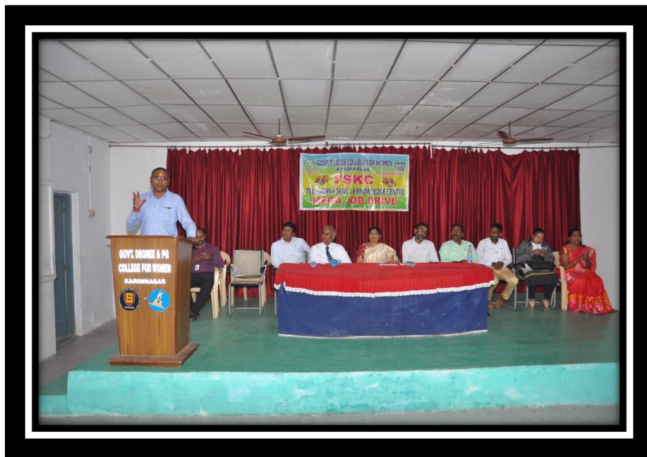
HR from Vector Soft skills Addressing