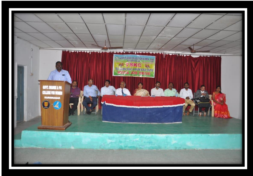
Address by HR from Star health insurance