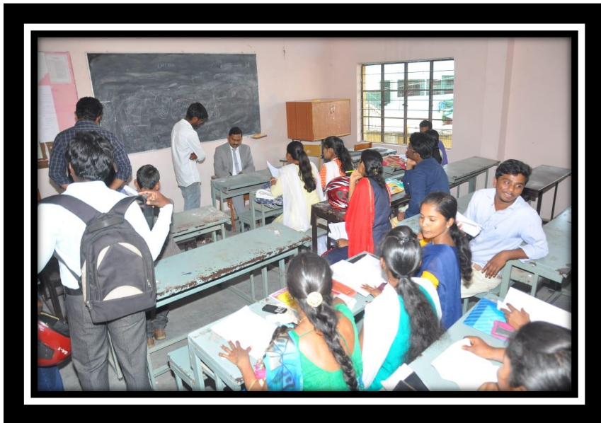
HR from Adarsha Motors conducting interview