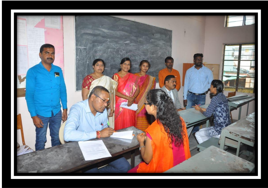
TSKC team with Adarsha automotives Pvt. Ltd.