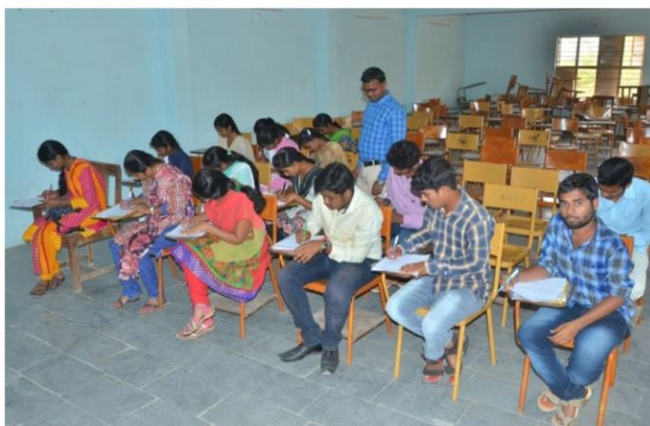
ICICI WRITTEN TEST