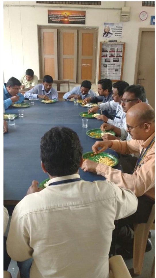
HRs Taking LUNCH