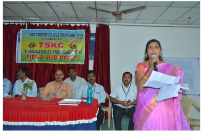
ADRESSING THE HRs