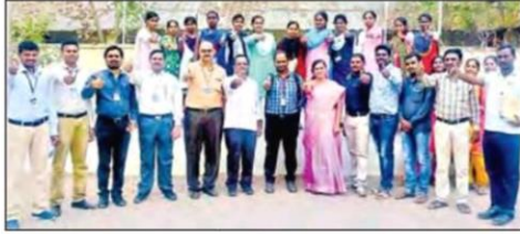
ప్రాంగణ నియామకాల్లో ఎంపికైన విద్యార్థినులు