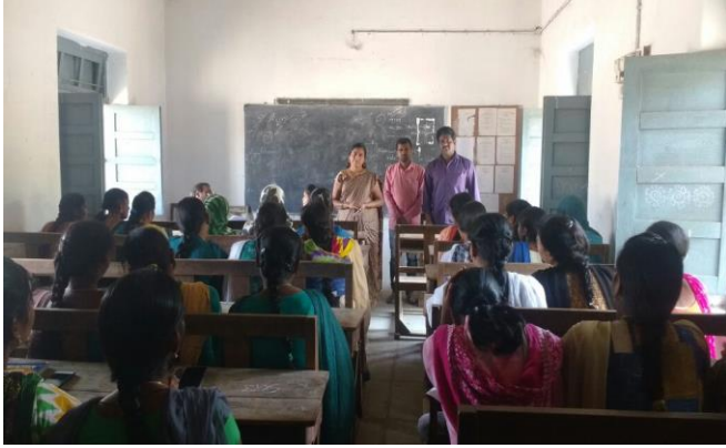
ADHARSHA MOTARS INTERVIEW ROOM