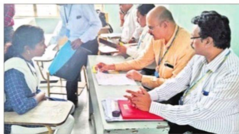
విద్యార్థినిని ఇంటర్వ్యూ చేస్తున్న సిబ్బంది