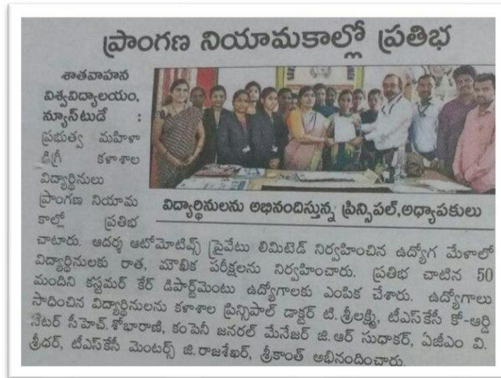
PRESS CLIP ON EENADU