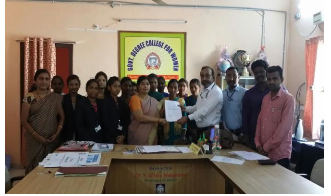
GROUP PHOTO WITH SELECTED CANDIDATES IN ADHARSHA MOTARS