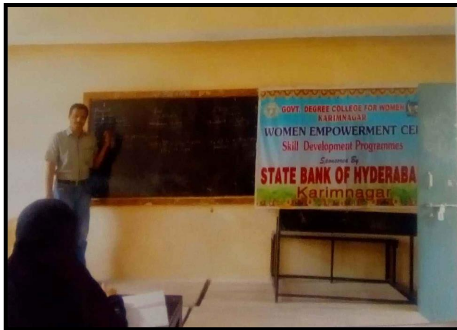
Coaching for English for Competitive Exams