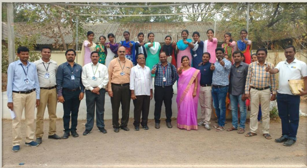
GROUP PHOTO WITH SELECTED CANDIDATES & HRs