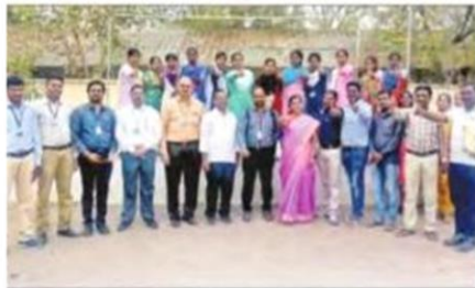
ఎంపికైన అభ్యర్థులతో కళాశాల సిబ్బంది, కంపెనీ ప్రతినిధులు