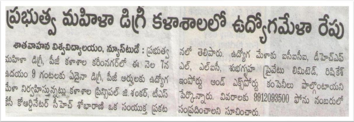
Clipping of Eenadu news paper on 06/02/2018