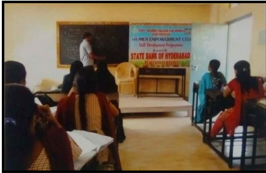
Coaching for Bank Exams