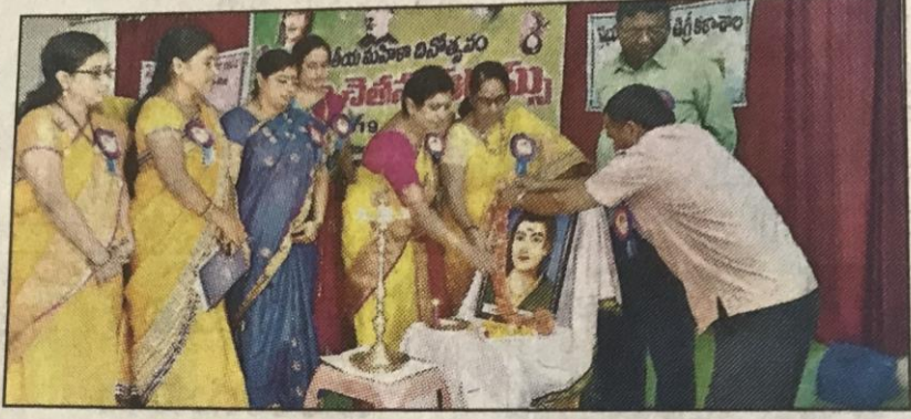
సదస్సులో జ్యోతి వెరిగిస్తున్న అతిథులు

నిచ్చారు. బుధవారం మహిళా దినోత్సవం పురస్కరించుకొని ತಲಂಗಾಣ ರచಯಿತಲ ವೆದಿಕ(ತರವೆ), ಕಳಾ శాల తెలుగు విభాగం, మహిళా సాధికార విభాగం సంయుక్తంగా నిర్వహించిన మహీళా చైతన్య సదస్సులో ప్రసంగిం చారు. విద్యార్థినులు, మహిళలపై జరుగు తున్న దాడులను [పేమోన్మాద దాడులని వర్ణించడం అర్థరహితమన్నారు. ప్రస్తుత నాగరిక సమాజానికి నిజమైన [పేమ ఏమిటో అనుభవంలోకి రాలేదన్నారు. మహిళలపై జరిగే దురాగతాలను ఉన్నాద ూడులుగా పేర్కోవాలన్నారు. ప్రముఖ